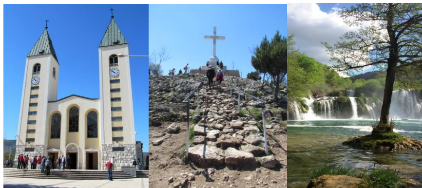
Kirche in Medjugorje

Zum 9.Mal reisen wir mit dem Bus an diesen wunderbaren Ort, welcher die Pilger in Staunen versetzt und mit dem Gefühl einer liebevollen göttlichen Umarmung umgibt.