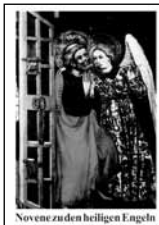
Novene zu den heiligen Engeln